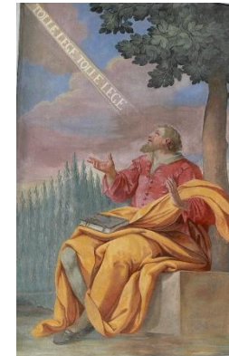
Fresco in Augustinerkirche in Rattenberg. Foto van Wolfgang Sauber.

Het Augustijns Historisch Instituut presenteert: